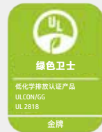
UL绿色卫士金牌认证 9

HP Latex墨水独树一帜 — 印品无臭无味，可安心置于溶剂墨水无法企及的任何环境。